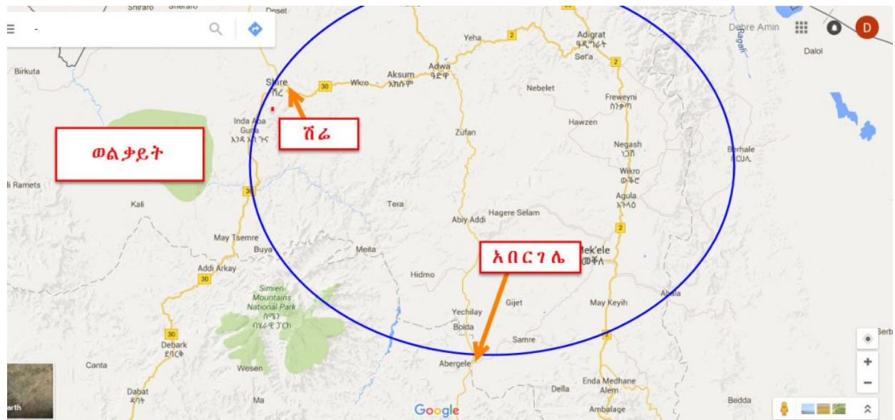
Map – northern Ethiopia areas

“The territory of Tigray whose capital is Adwa is bounded on the west by Shire, on the south west by Temben and Adet, on the south by Geralta, on the South East by Haramat, on the East by Agamae, and on the North by the Rivers Mereb and Belessa”